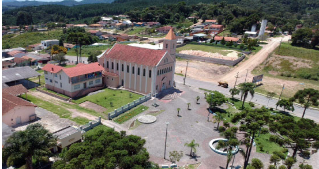
Centro da cidade