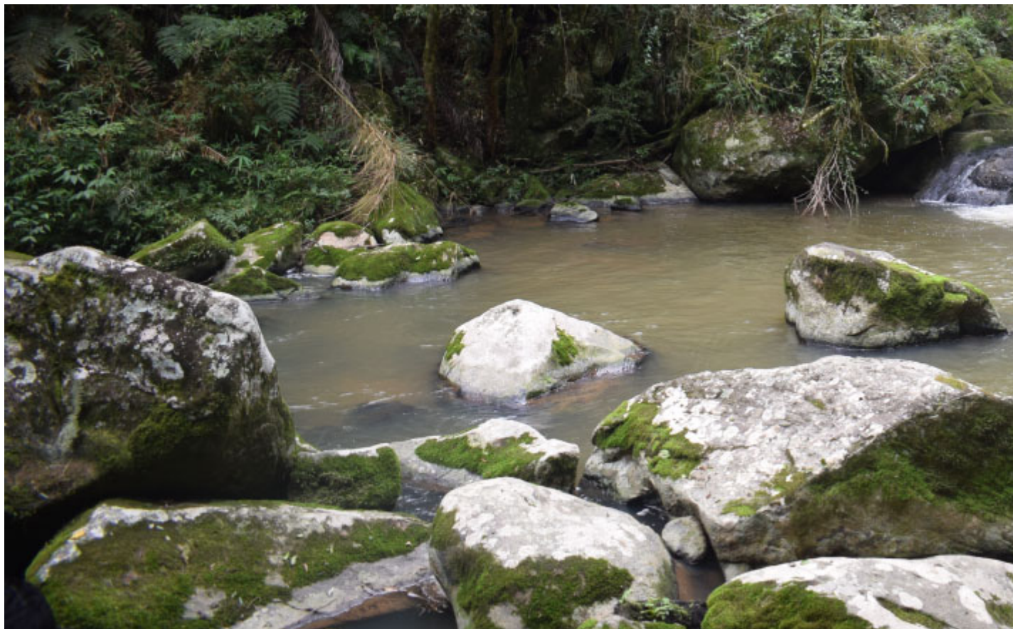
Riacho Taboão