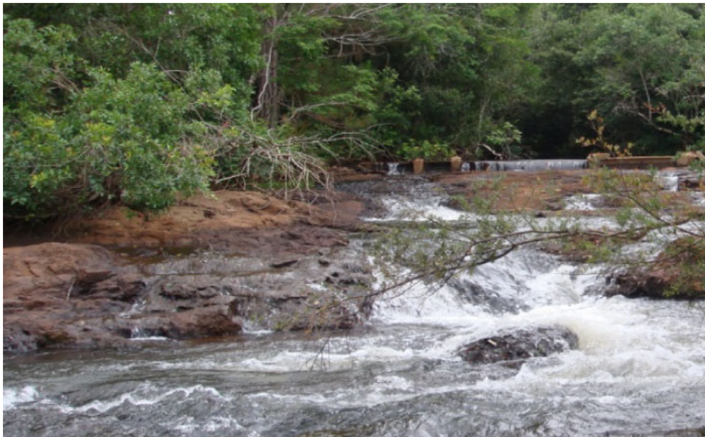
Cachoeira Fávero