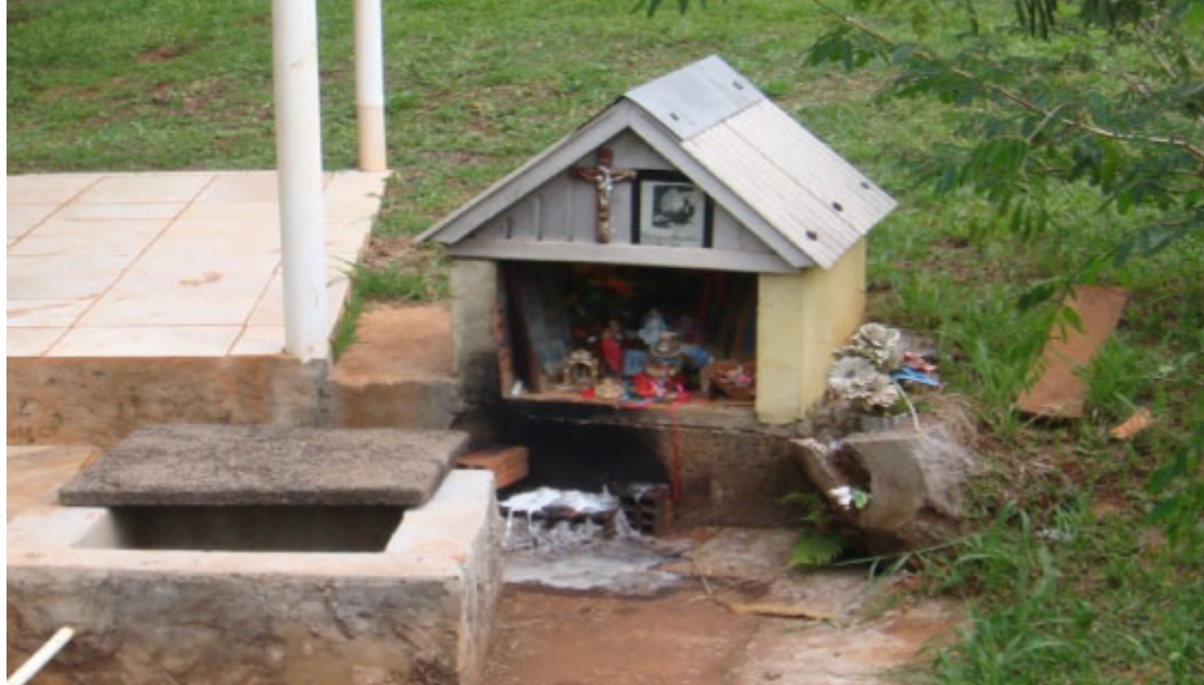
Olho D'Água de São João Maria