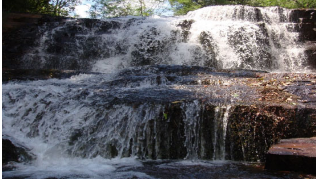
Cachoeira Goetzinger - Foto: Prefeitura de Foz do Jordão