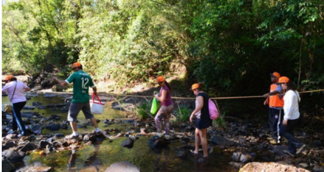
Caminhada da Natureza