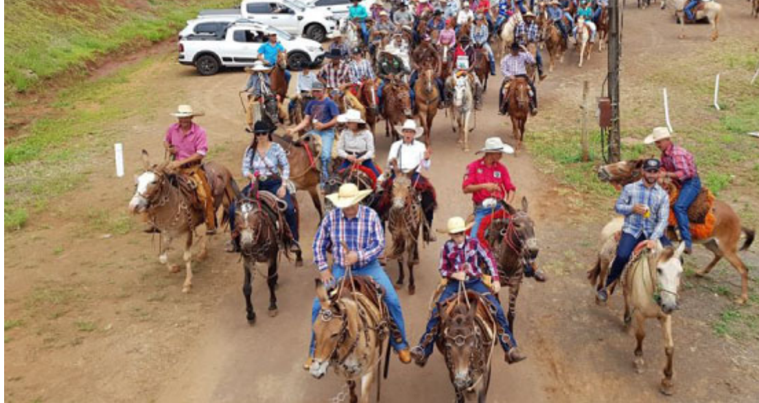
Cavalgada de São Pedro