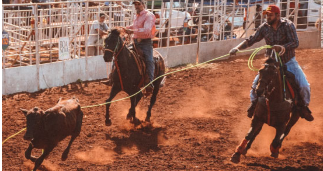
Ranch Fest