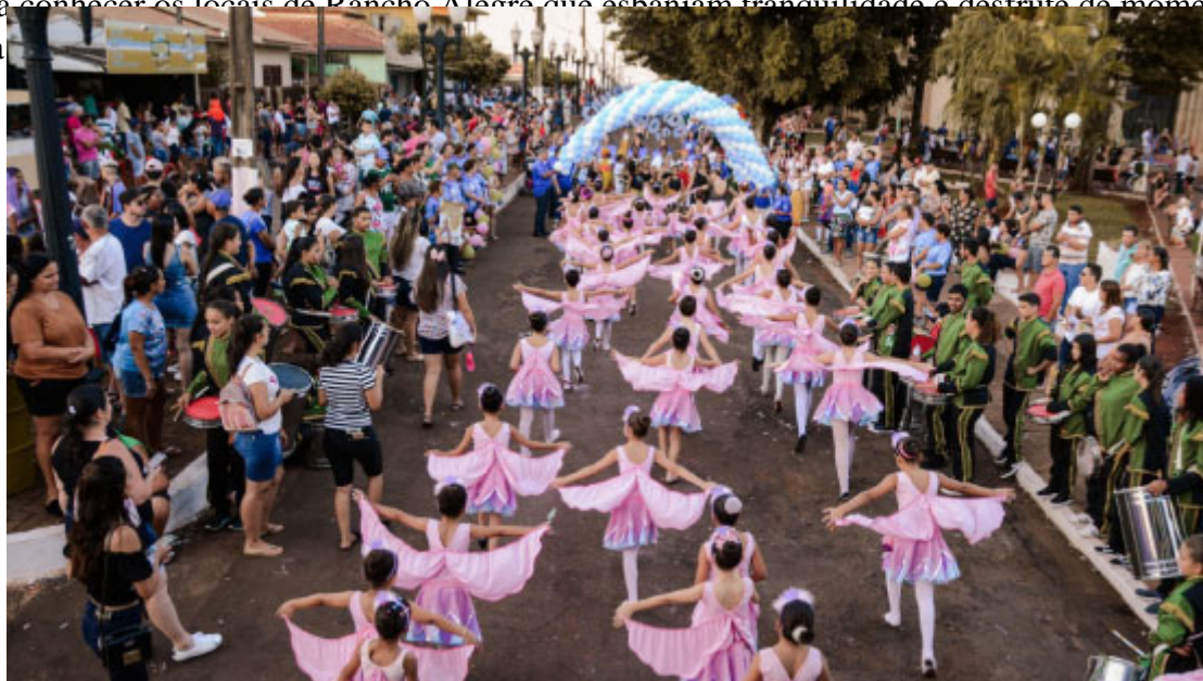
Desfile de aniversário da cidade

Venha conhecer os locais de Rancho Alegre que esbanjam tranquilidade e desfrute de momentos agradáveis com a