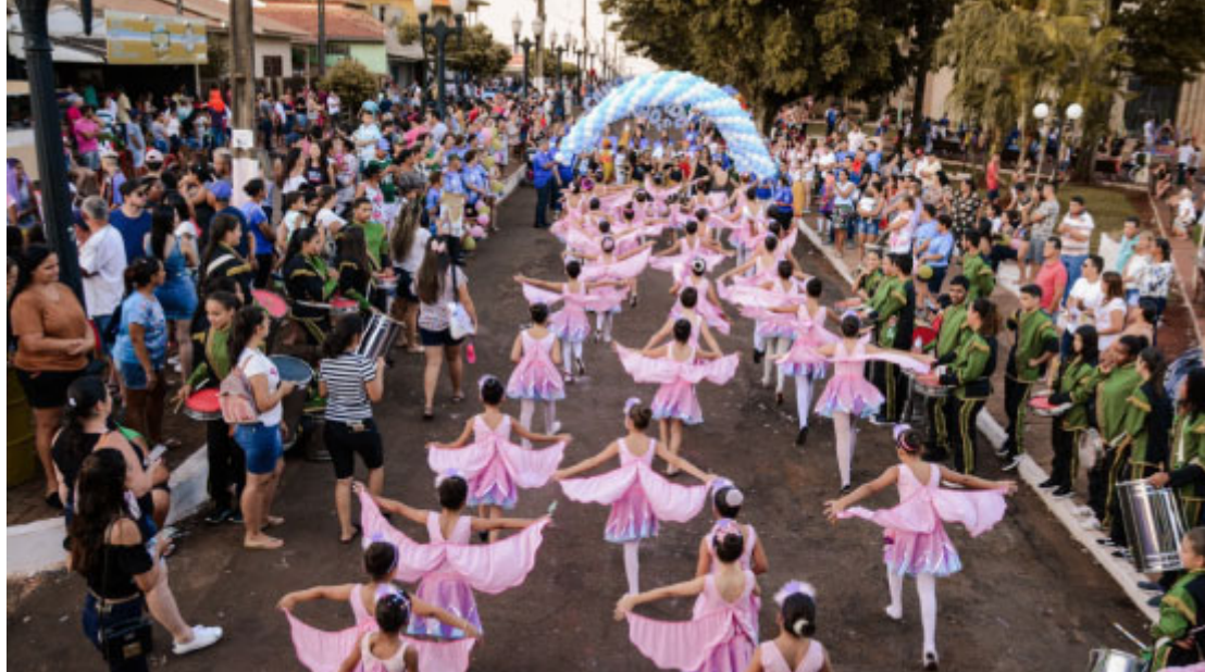
Desfile de aniversário da cidade