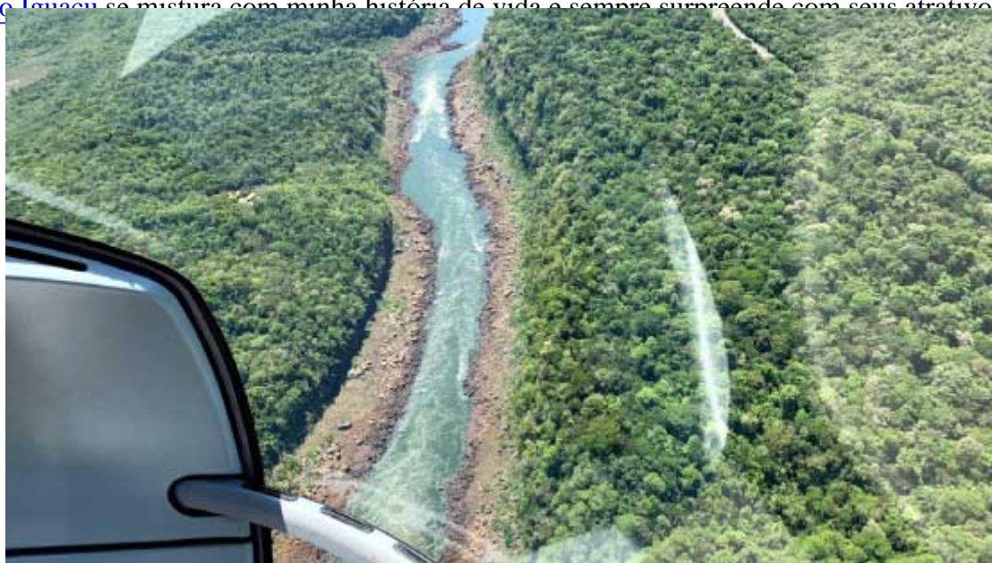
Passeio de Helicóptero

Foz de Iguaçu se mistura com minha história de vida e sempre surpreende com seus atrativos. Espero ainda poder