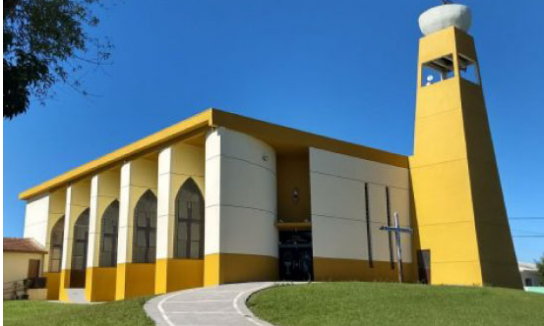
Paróquia Matriz São Carlos Borromeu - Foto: Prefeitura de Paula Freitas