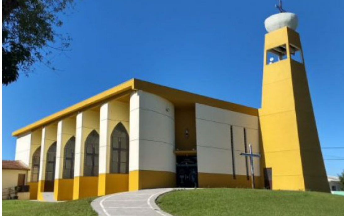
Paróquia Matriz São Carlos Borromeu