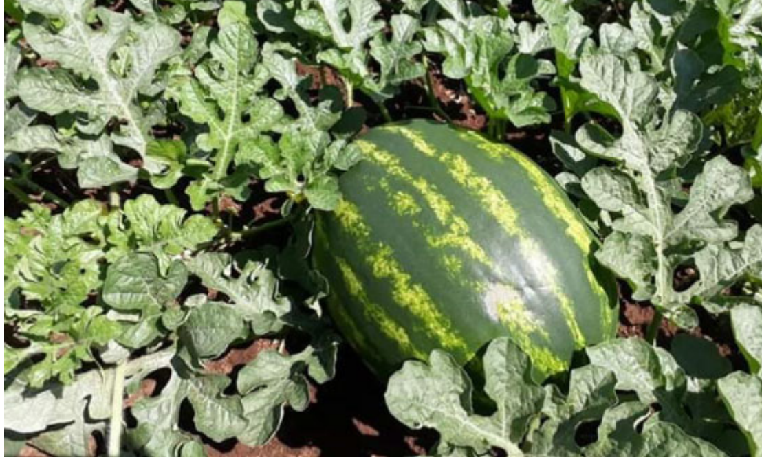
Lavoura de melancia