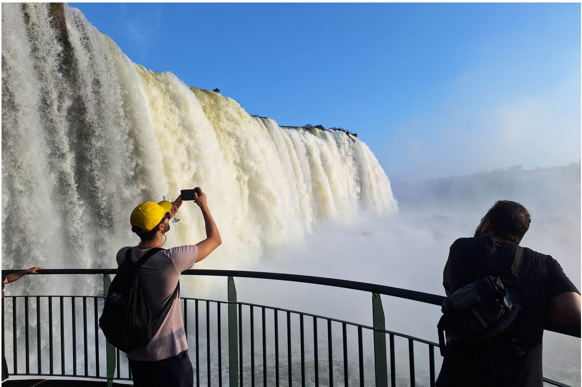
Créditos Viaje Paraná