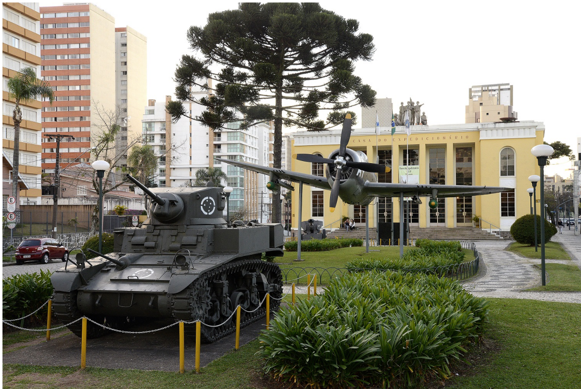
Museu do Expedicionário

OS MELHORES DOS MELHORES - Dentro da listagem, há também o Travellers' Choice Os Melhores dos Melhores, que reconhece atrativos especiais, com grande fluxo e intenso registro de avaliações positivas dos usuários da plataforma. Nele, as Cataratas do Iguaçu - uma das Sete Maravilhas Naturais do Mundo, em Foz do Iguaçu - ficou em 1º lugar como o principal atrativo do Brasil e da América do Sul em 2025, junto do Jardim Botânico de Curitiba (4º lugar nacional e 5º lugar continental) e da Usina Hidrelétrica de Itaipu (9º lugar nacional).