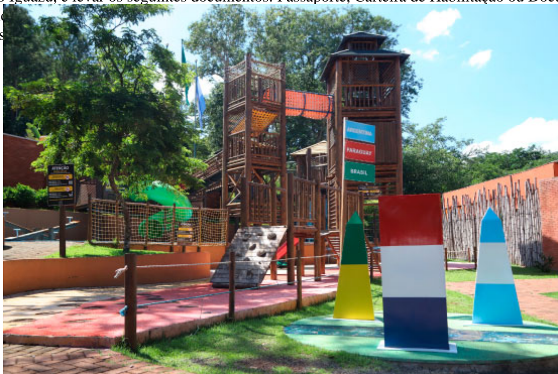
Marco das Três Fronteiras - Foto: José Fernando Ogura / Acervo EPR

Uma dica importante para quem visita a Foz do Iguaçu e quer conhecer a Argentina, mais precisamente Puerto Iguazu, é levar os seguintes documentos: Passaporte, Carteira de Habilitação ou Documento de Identidade. Para quem não tem idade, é necessário um documento de identidade, é