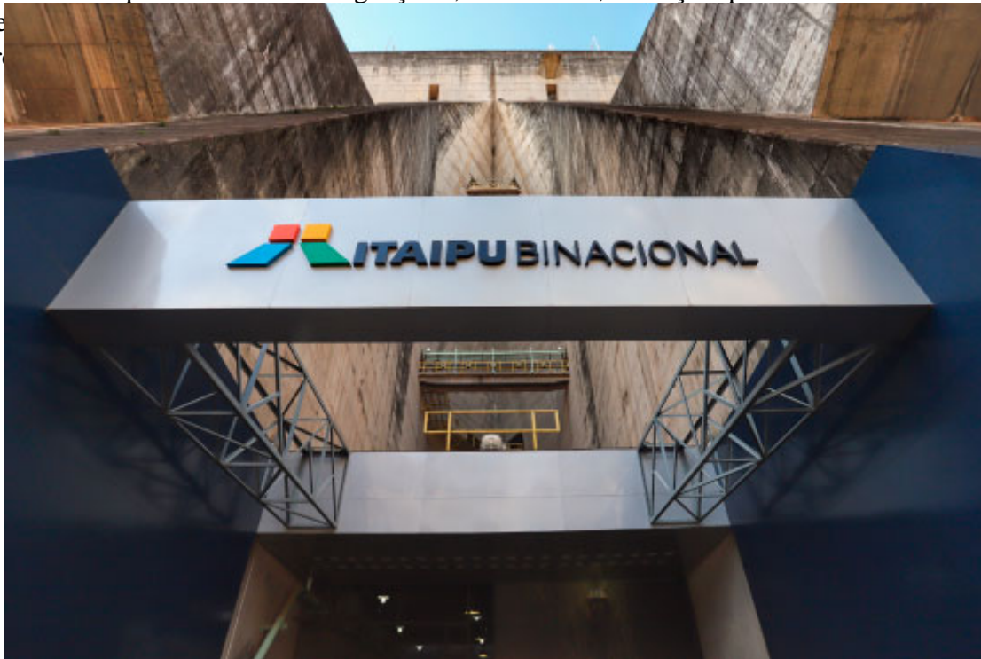
Itaipu Binacional

O principal cartão postal da cidade é as Cataratas do Iguaçu, um complexo de 275 quedas que se estendem por quase cinco quilômetros do Rio Iguaçu. É, sem dúvida, a atração que mais encanta os visitantes. A cidade também possui o Parque das Aves, o Mar