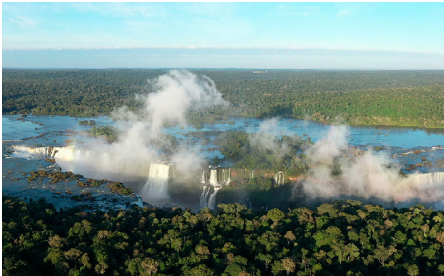
Cataratas do Iguaçu