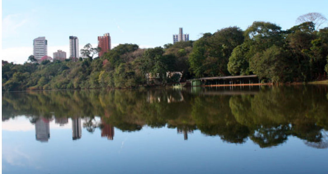
Parque do Ingá