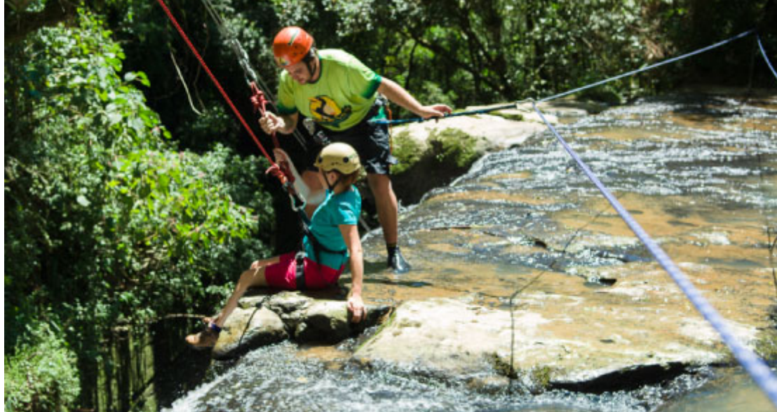
Ninho do Corvo