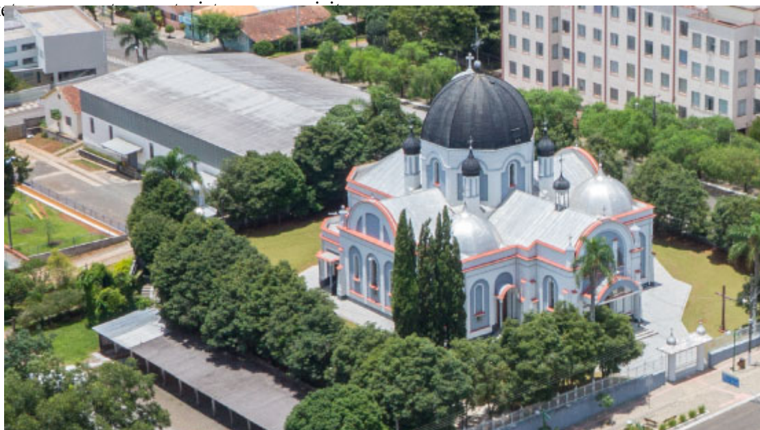
Igreja de São Josafat

Além das cachoeiras gigantes, a cidade, que é a maior produtora de feijão preto do Brasil, tem ruas calmas e locais aconchegantes. As dezenas de igrejas católicas de ritos latino e bizantino ucraniano com suas belas arquiteturas