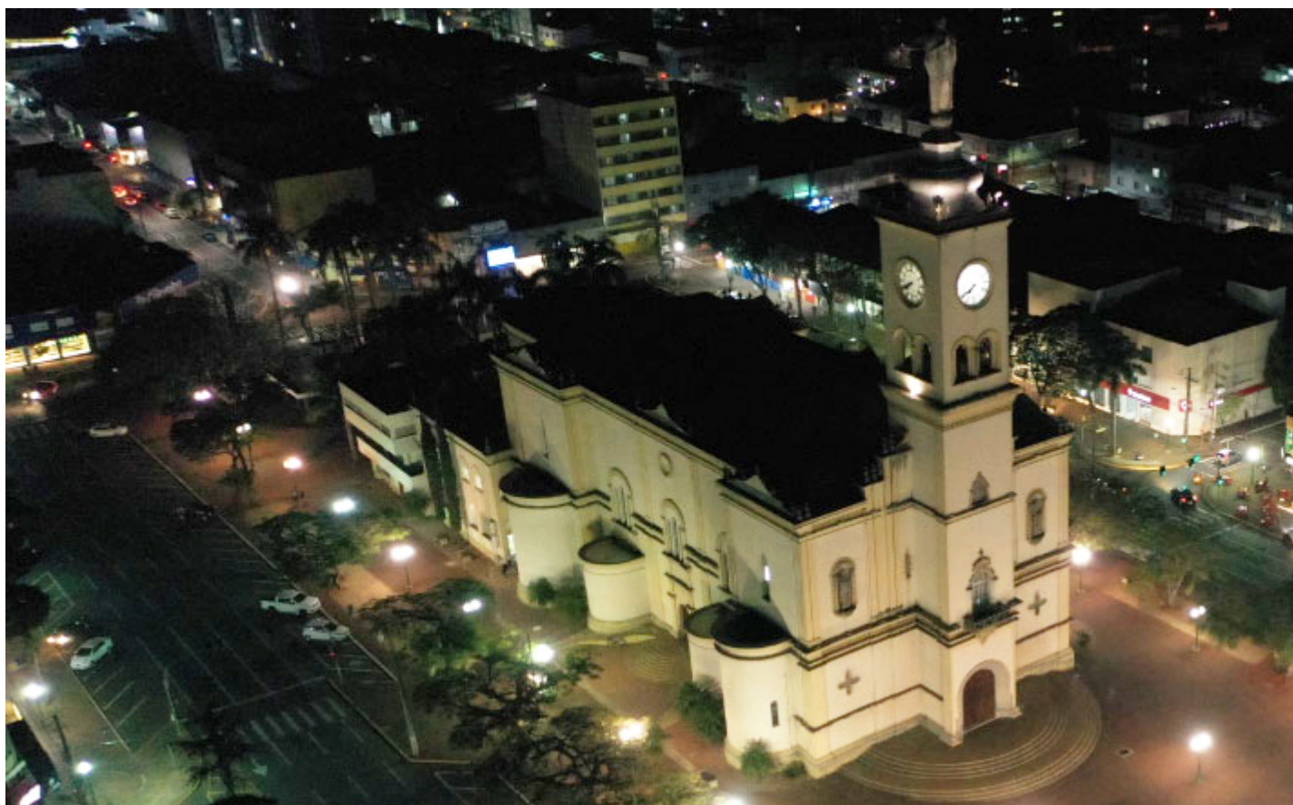
Catedral Nossa Senhora de Lourdes