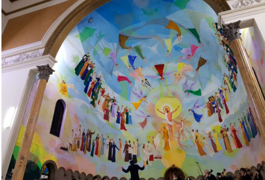
Catedral Nossa Senhora de Lourdes