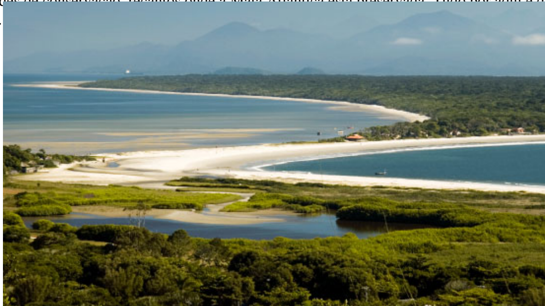
Ilha do Mel

Parece que o Paraná foi feito para surpreender você. O Estado é maior que muitos países, como Uruguai, Grécia, Áustria e Portugal. Quando a gente pensa no território, é fácil entender por que o Paraná tem opções que agradam a todos: praias de água salgada e doce, campo com o charme do interior, ilhas que podem ser chamadas de paraísos, a estrutura das grandes metrópoles e também natureza exuberante. São cerca de 90 unidades de conservação, recantos onde a Mata Atlântica está preservada. Tudo por aqui é de encher os olhos.