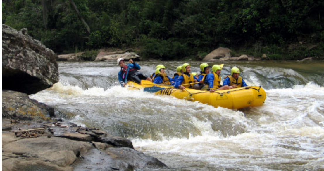
Rafting em Jaguariáiva