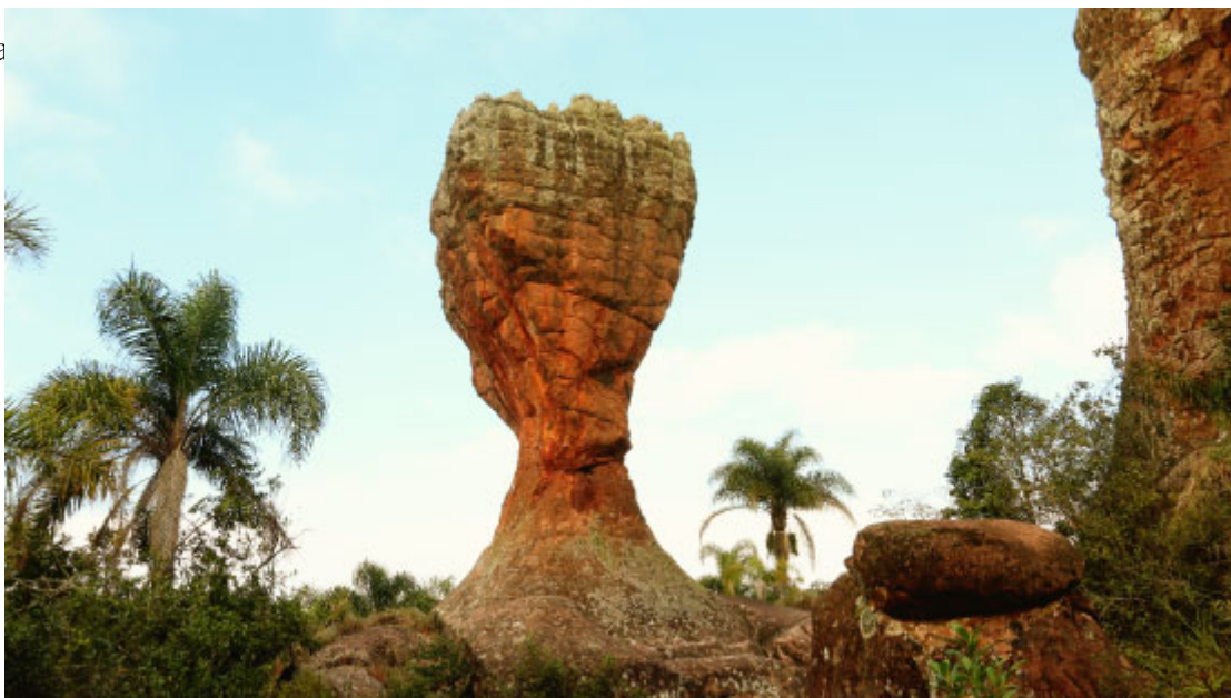
A Taça, Parque Estadual de Vila Velha