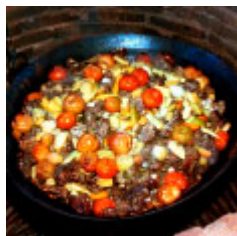
Carneiro no Buraco