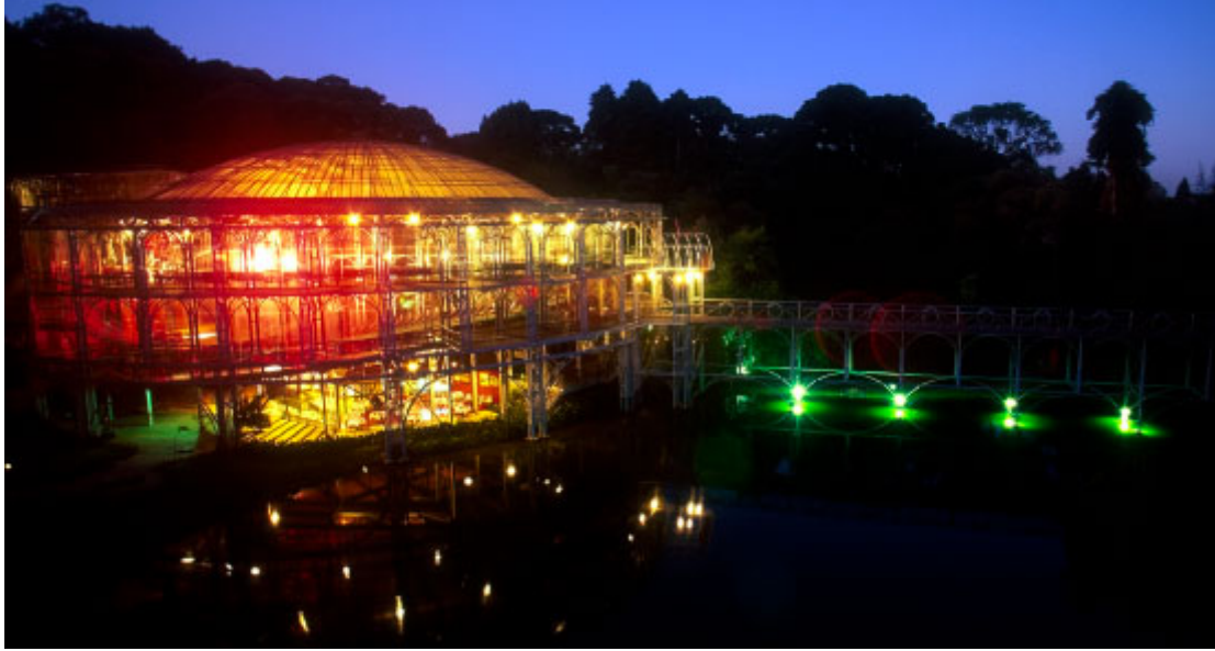
Ópera de Arame em Curitiba

Quem vem de longe, pode escolher entre os oito aeroportos nas diferentes regiões do Estado. E quem prefere cair na estrada, dá carona para ótimos momentos. A qualidade das rodovias permite rodar e se encantar a cada curva do caminho.