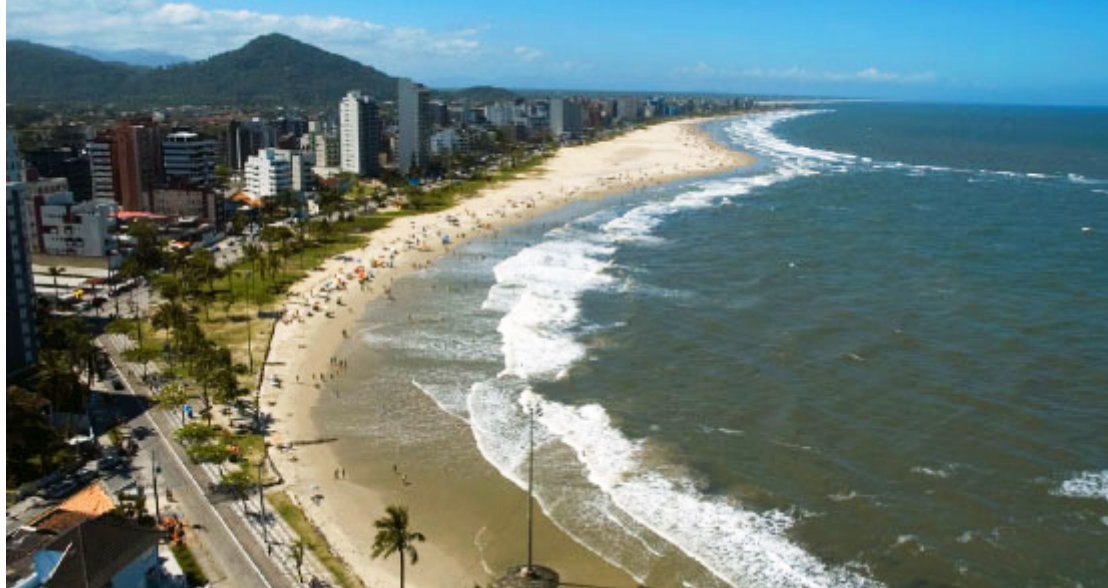
Praia de Matinhos - Foto: Acervo SEBRAE - Priscila Forone / Paraná Turismo