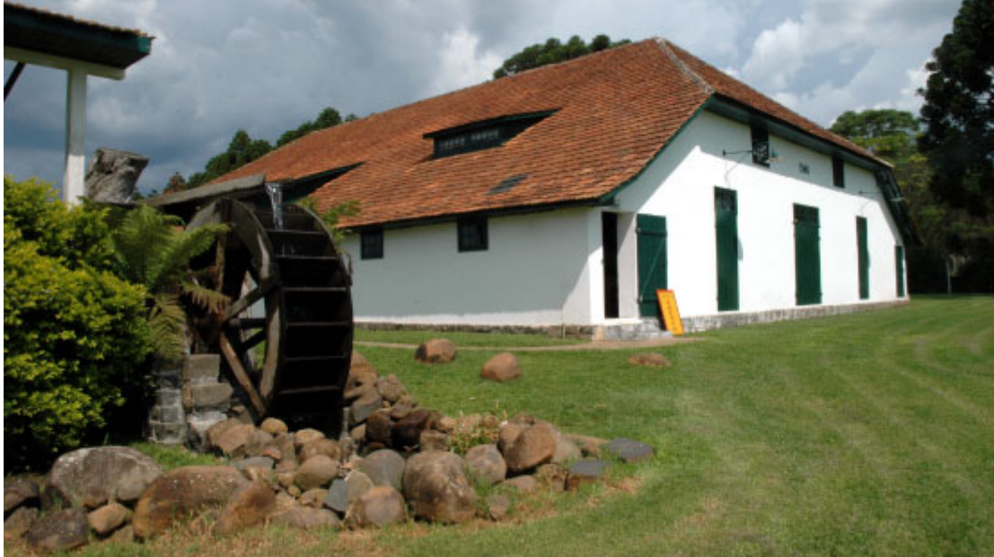
Casa da Memória