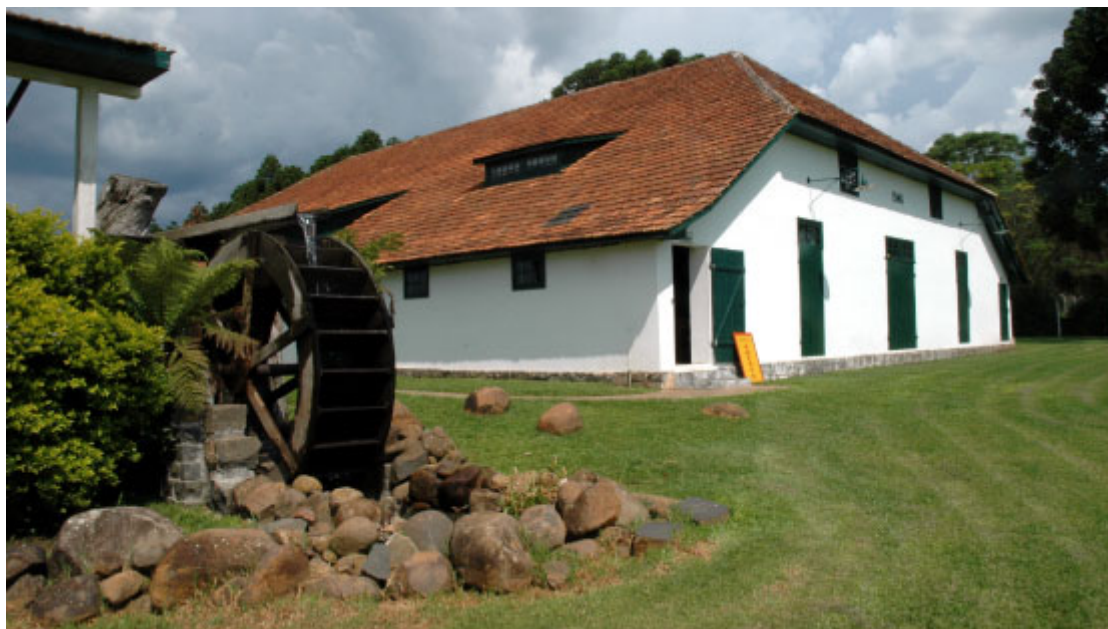
Casa da Memória