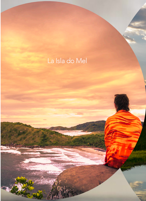
La Isla do Mel