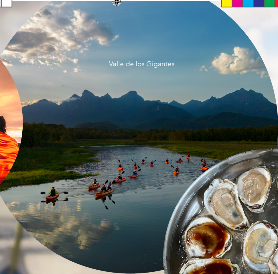
Valle de los Gigantes