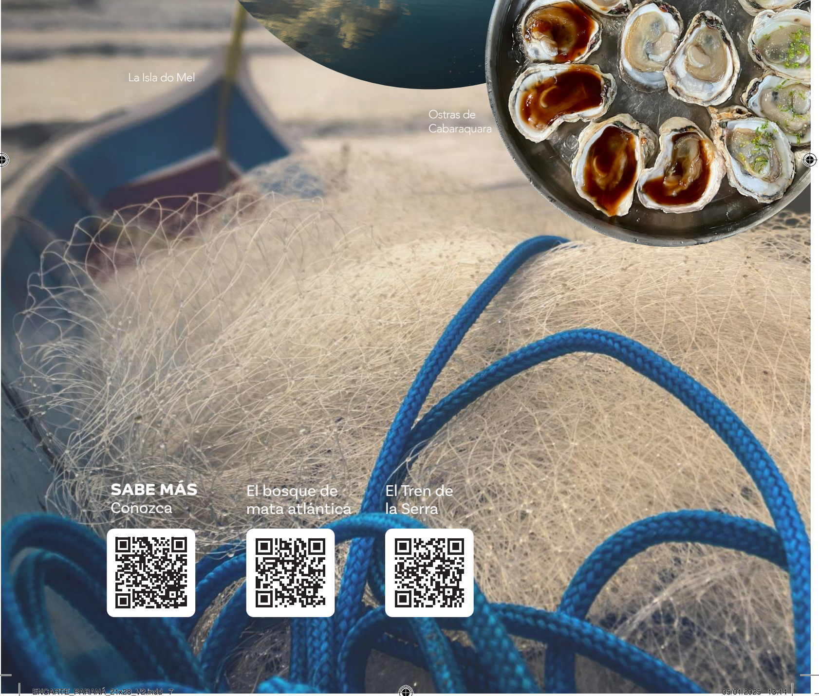
La Isla do Mel