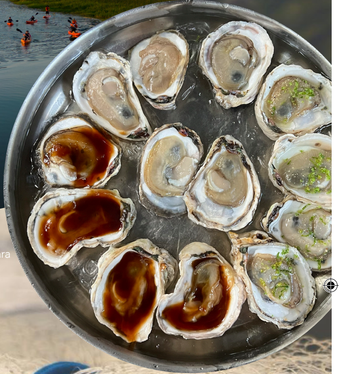
Ostras de Cabaraquara