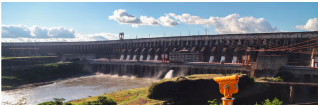
Itaipu Binacional, Foz do Iguaçu

Aproveite que estará pelo Complexo Turístico de Itaipu e visite também os blocos temáticos do Ecomuseu. Há maquetes interativas, peças históricas, além dos aspectos sociais e de preservação ambiental da região, como os refúgios ecológicos de Foz do Iguaçu e Santa Helena .