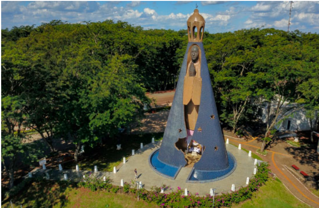
Monumento à Nossa Senhora Aparecida, Itaipulândia

Quem busca a renovação da fé encontrará na região vários locais para momentos de reflexão. Os municípios de Santa Helena , Foz do Iguaçu , Itaipulândia e Missal , por exemplo, são conhecidos por terem monumentos religiosos que atraem fiéis de diversas partes do Brasil. Recantos cheios