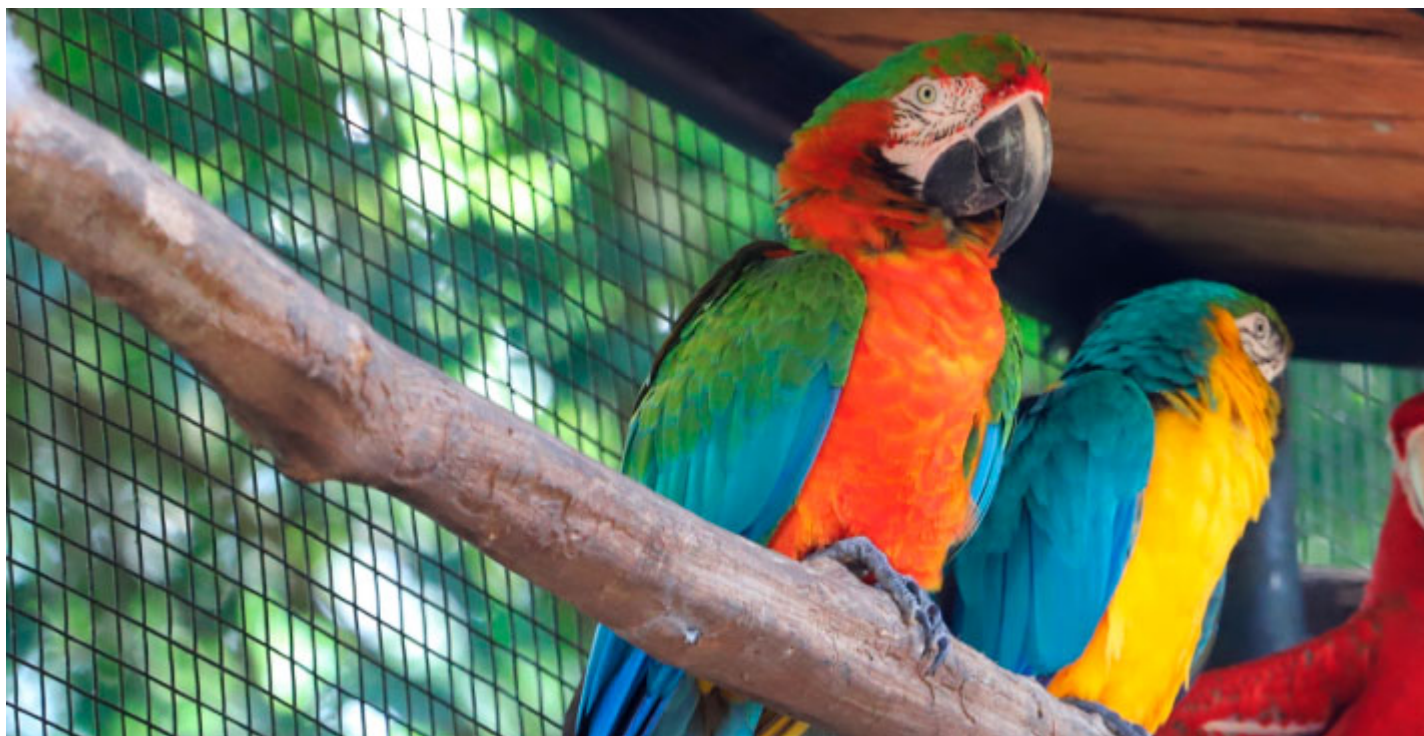
Parque das Aves, Foz do Iguaçu

Para o turista que gosta de prestigiar os eventos e festividades locais, os municípios da região irão proporcionar horas de muita diversão e cultura. Não deixe de conferir o Arrancadão de Jericos em Serranópolis do Iguaçu e o Festival Interno da Canção de Ramilândia. Além de ser uma oportunidade para ampliar os contatos comerciais, muita emoção e adrenalina o aguardam.