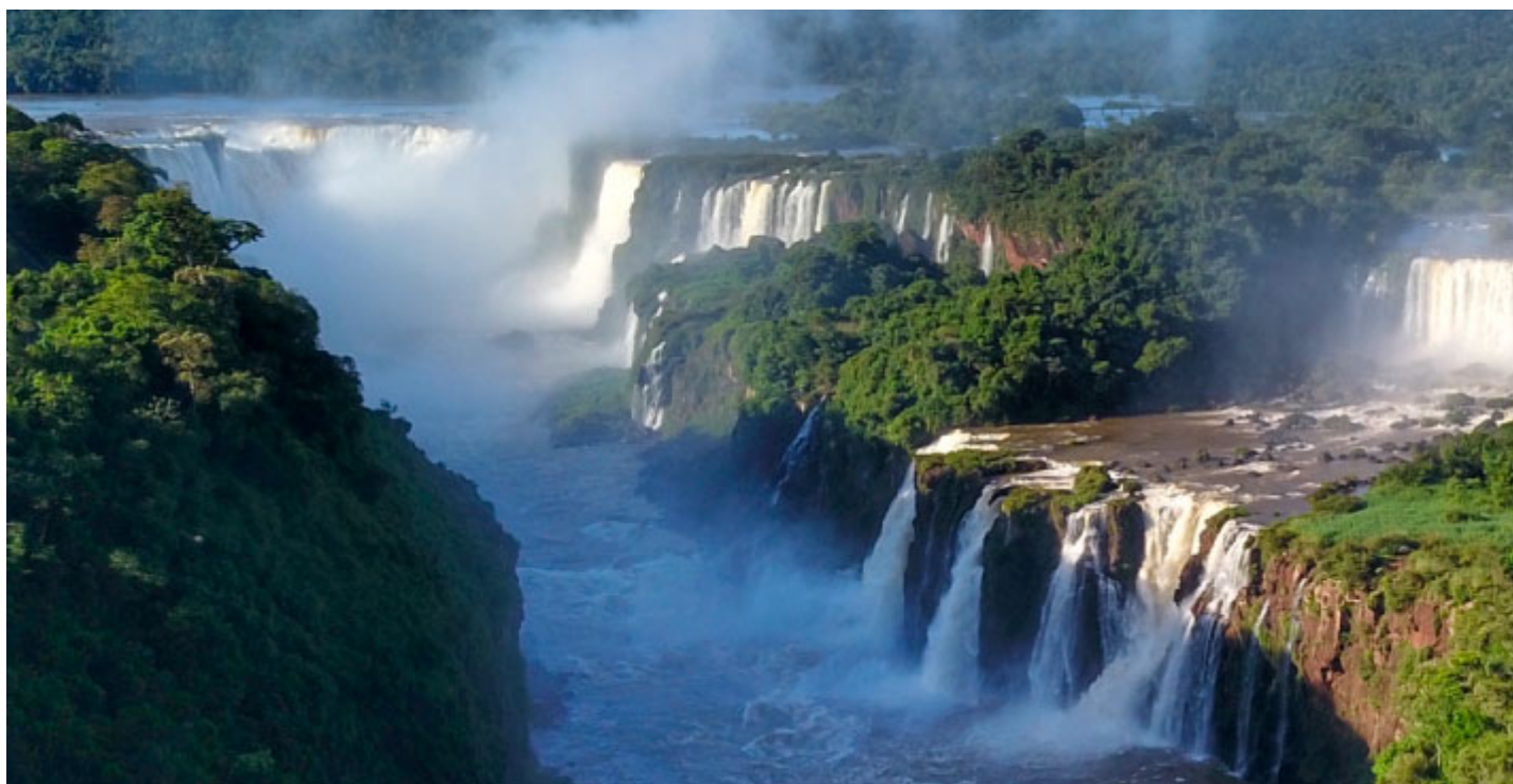
Cataratas do Iguazu, Foz do Iguazu - Foto: José Fernando Ogura / Acervo EPR