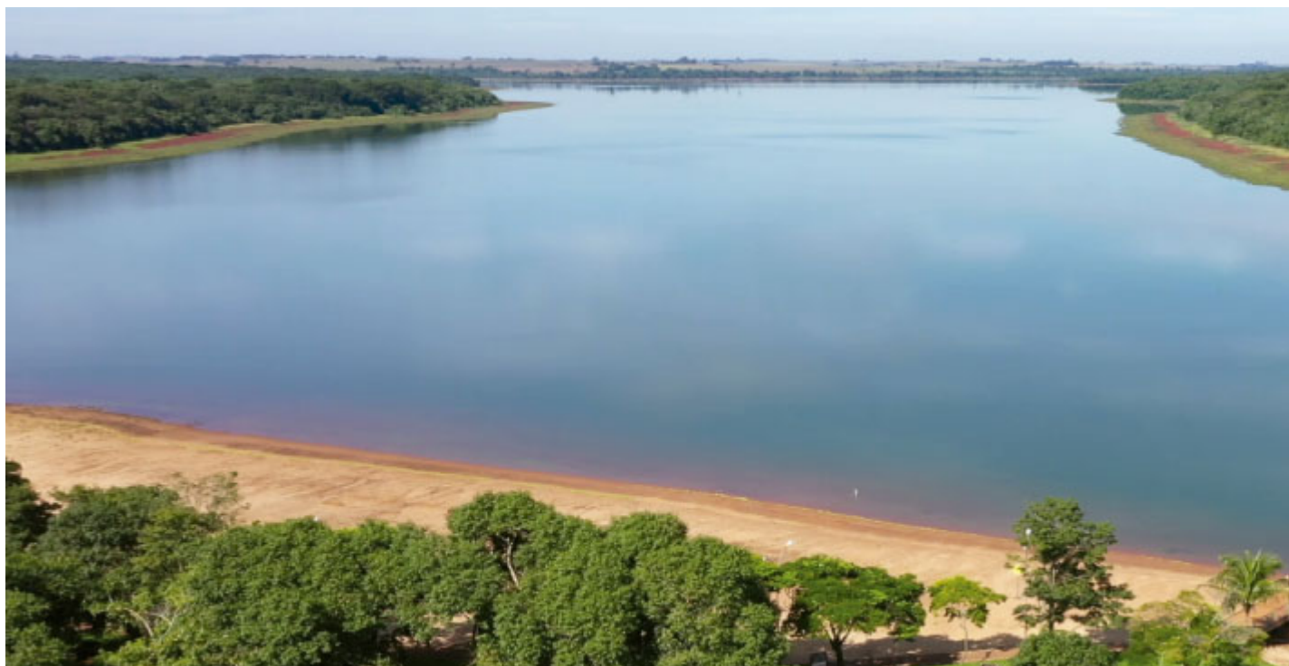
Lago de Itaipu, Itaipurândia